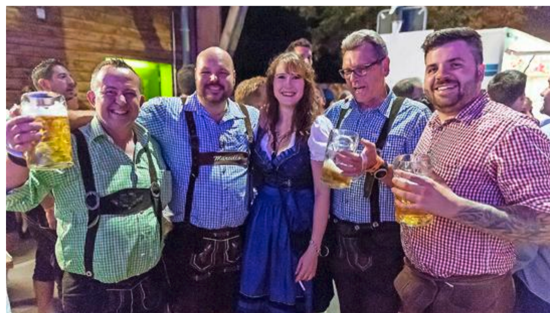
Kein Oktoberfest ohne Bier – eine Mass gehört einfach dazu.

Der deutsche SPD-Chef und langjährige EU-Parlamentspräsident Martin Schulz forderte gestern Sonntag auf Twitter: «Madrid und Barcelona müssen sofort deeskalieren und den Dialog suchen.» sda/mhg SEITE 19