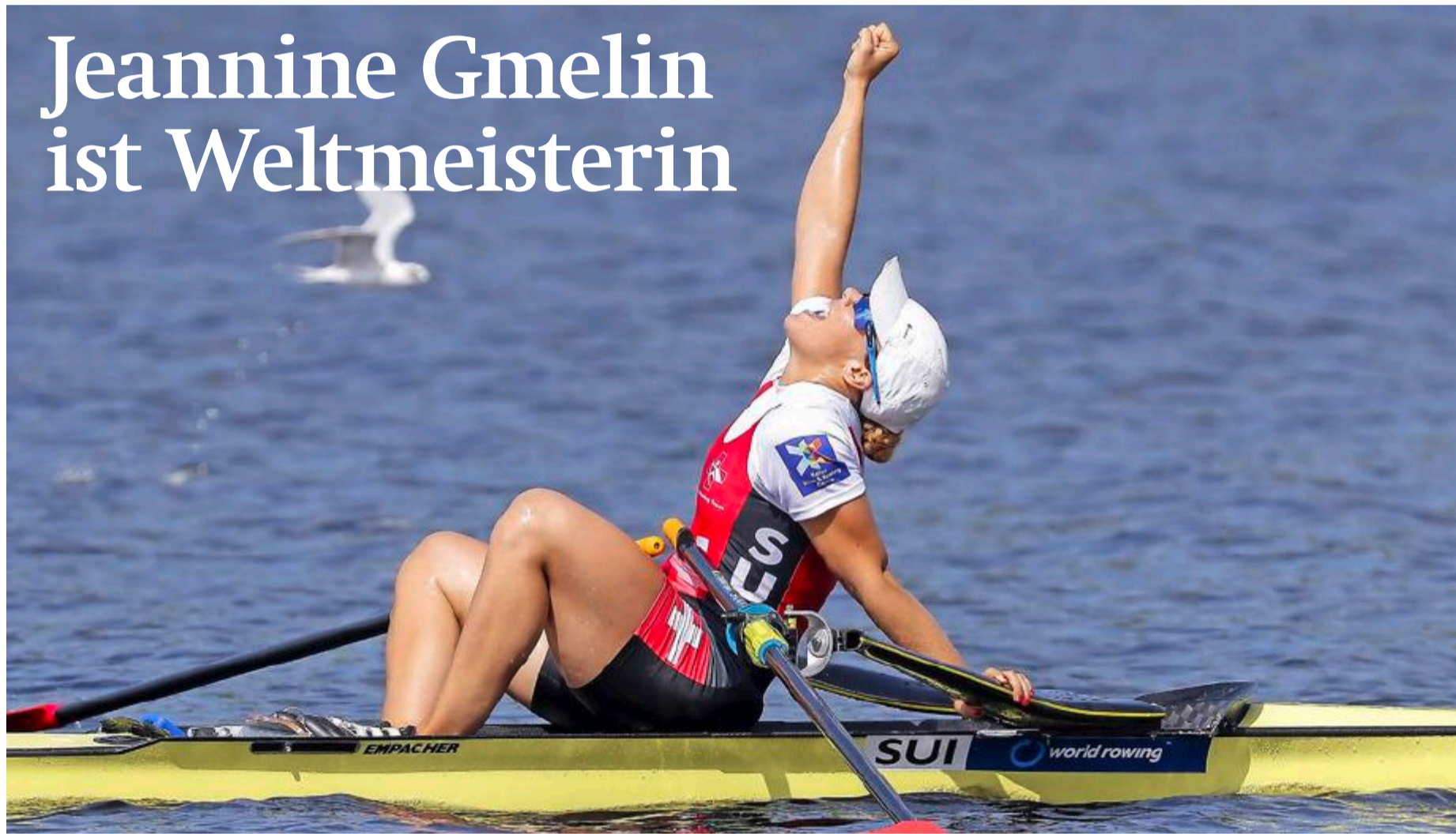
Ein Stück Sportgeschichte geschrieben: Jeannine Gmelin ist die erste Schweizer Ruderin, die in einer olympischen Bootsklasse eine WM-Medaille gewonnen hat.